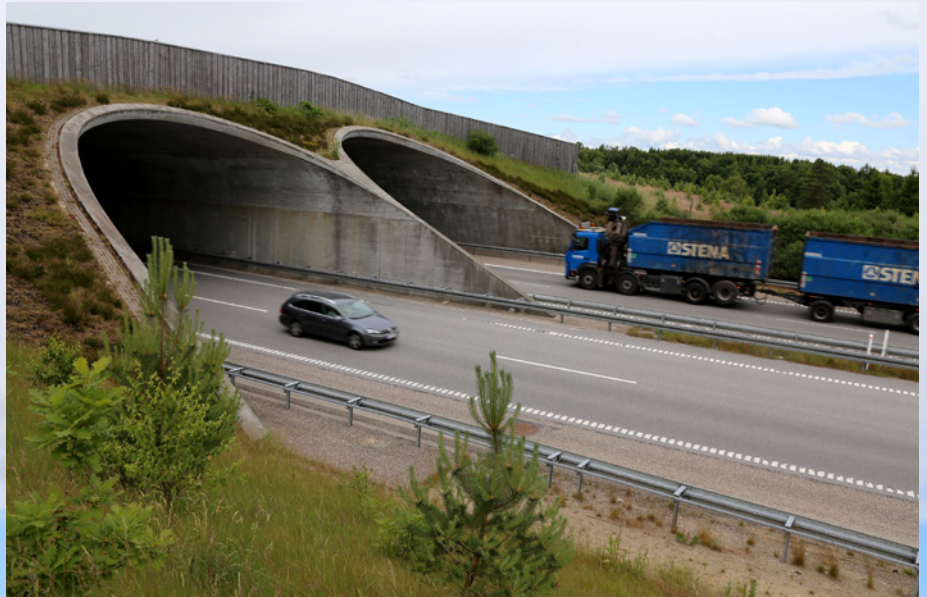
Sådan oplever bilisterne faunapassagen, når de kommer fra øst, fra Silkeborg siden.