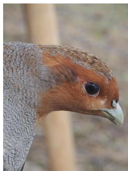
Agerhønsene er netop nu på udkig efter den perfekte redebiotop.

I hæftet beskrives forskellige vildtplejetiltag, deres formål og hvordan de etableres, samt hvilke regler der gælder, i forhold til at opretholde grundbetaling på arealet. Ligeledes beskrives mulighederne for natur og vildtpleje