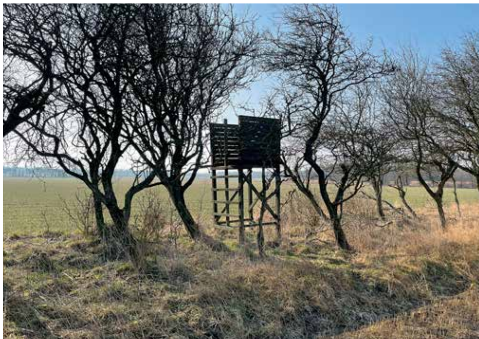
Da hverken et enkelt træ eller et hegn i sig selv udgør en skov, er dette skydetårn ikke placeret lovligt. Som hovedregel anser man således et areal for at være skov, hvis det er bevokset med træer, som danner eller indenfor et rimeligt tidsrum ville danne sluttet skov af højstammede træer, og hvis det som hovedregel er større end 0,5 hektar og mere end 20 m bredt.

Betingelsen for, at skydestiger kan anvendes uden for skove, er, at de er af ikke-permanent karakter. Det betyder, at de skal fjernes, når de ikke anvendes. Det er ikke klart, hvordan dette helt konkret skal fortolkes, men som minimum må man antage, at de