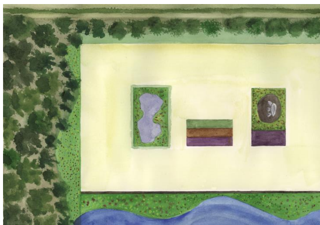
Kiler og områder med lavt udbytte kan med fordel udlægges som småbiotoper

Dette faktaark hjælper dig med at finde frem til de arealer, der kan være egnede til småbiotoper.