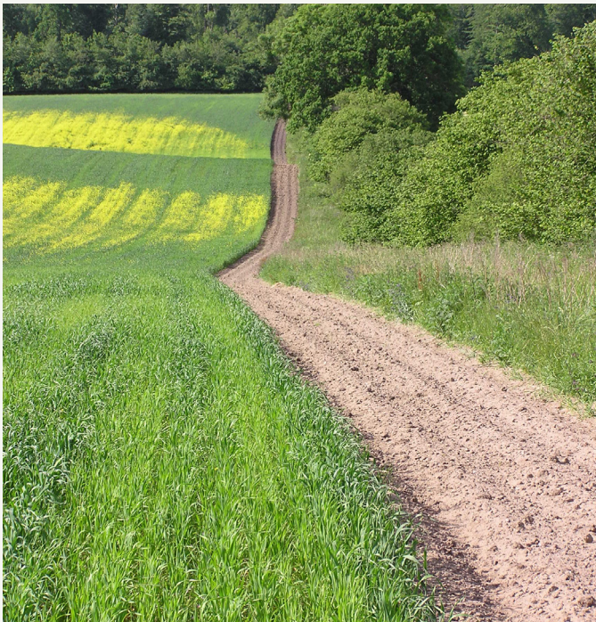
Barjordsstribe langs løvtræshegn.

Barjordsstriben er en 2 meter bred kultiveret stribe langs markkanten.