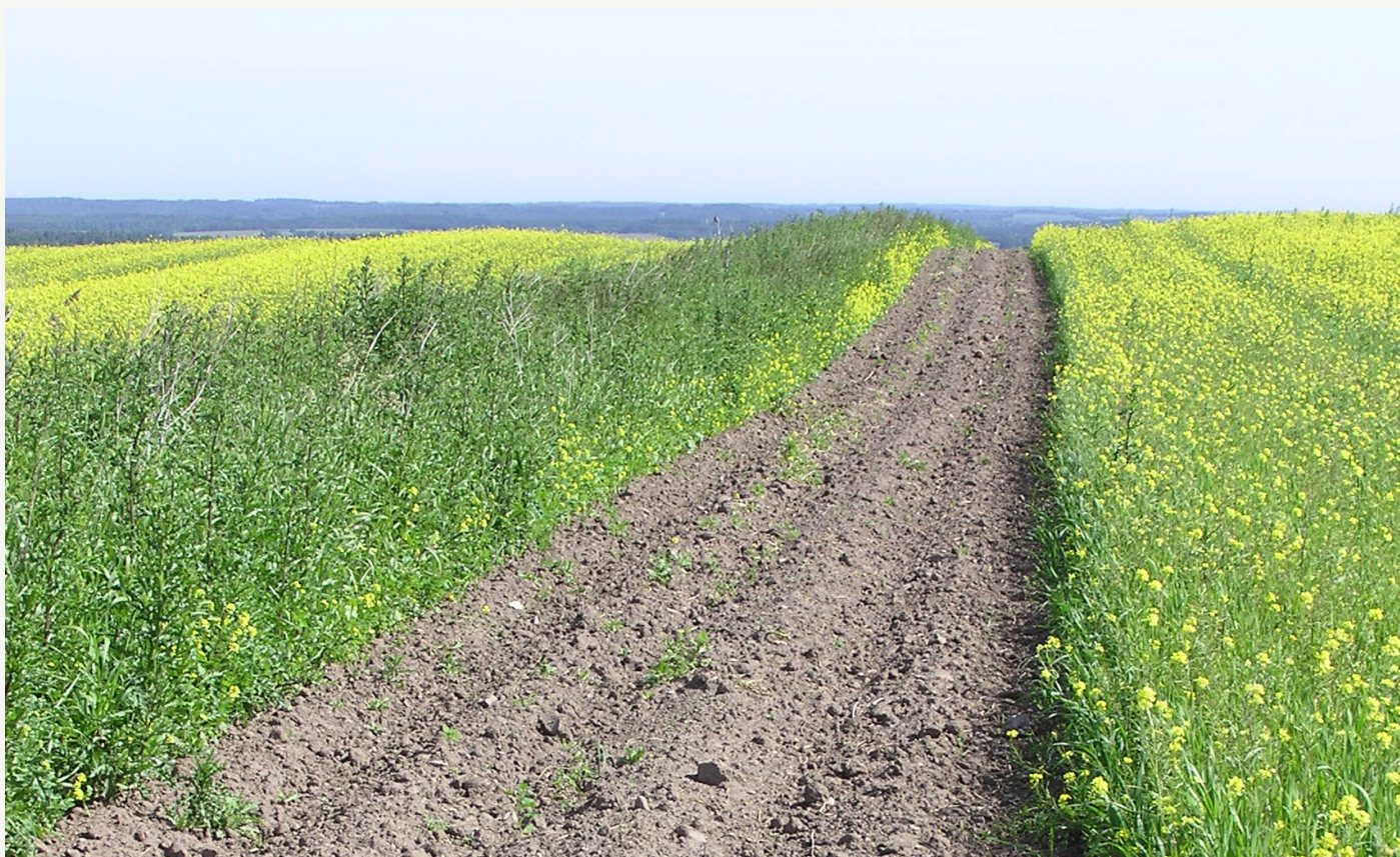
Nykultiveret 2 meter stribe.