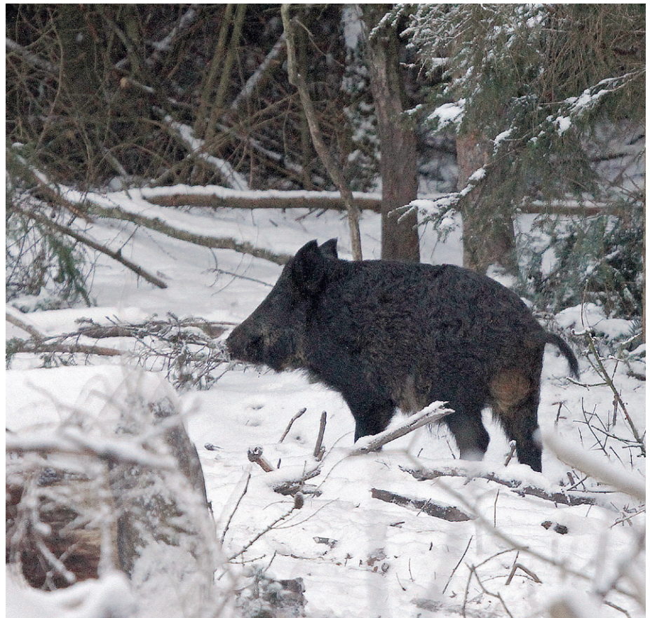
Tysklandsfarende danske jægere ved, at man mange steder skal være bevæbnet med blyfri riffelammunition.

Hvis vi accepterer, at forbuddet mod blyholdig riffelammunition på et eller andet tidspunkt også rammer Danmark, så står vi allerede nu i en bedre situation end i 1996. Lige nu har vi en enestående mulighed for at påvirke lovgiverne, så vi, når forbuddet træder i kraft, har en lovgivning, der passer til virkeligheden, og en virkelighed, der passer til jægerne. nvk@jaegerne.dk