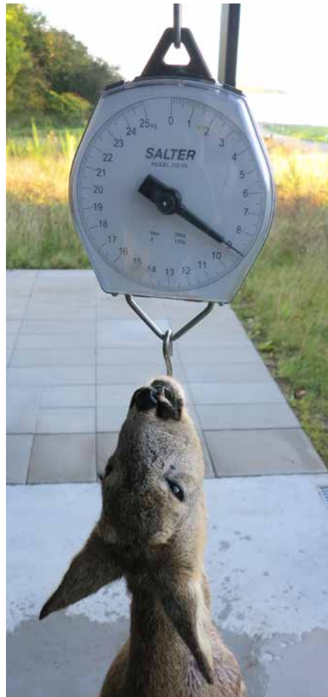
Et nedlagt rålam i oktober bør veje minimum 9 kg opbrækket (bukkelam 10 kg), og senere i sæsonen bør de to tal være 10 og 11 kg.

Da afskydningen i en bestand, uanset antal, i praksis ikke kan gennemføres på én dag, og vækstkurven i øvrigt flader betydeligt ud i vintermånederne, er det vægtforøgelsen over de tre måneder fra medio oktober til medio januar, der udtrykker det reelle billede og derfor er valgt som grundlag for denne artikel.