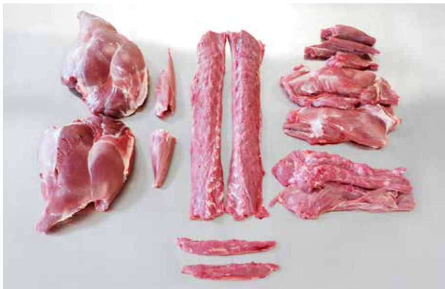
Omhyggeligt udskåret udgør kødandelen cirka 31 procent af lammets hele vægt.

En kendt vækstrate for råvildtet i forsøgsområdet viser en gennemsnitlig tilvækst (brækket vægt) fra oktober til januar på ca. et kg. Det betyder altså en tilvækst på blot 450 gram kød, men som det fremgår af figur 1, flader tilvæksten væsentligt ud omkring allerede 1. december, og den kødmæssige gevinst fra dette tidspunkt og frem er ubetydelig eller ikke eksisterende. Med andre ord findes der absolut ingen gode grunde til at påbegynde af-