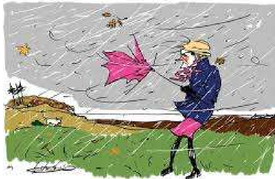
I regn og blæst

Specielt, når vi træner hvalp og unghund er vilkår afgørende.