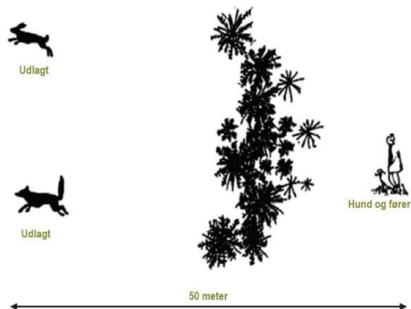
Fig. 3: Skitse over apportering af hårvildt

Der må ikke forefindes observatør ved hårvildtet under hundens afprøvning.