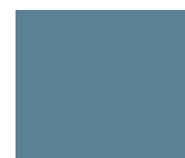
Bundbanner B 300x250 pixels