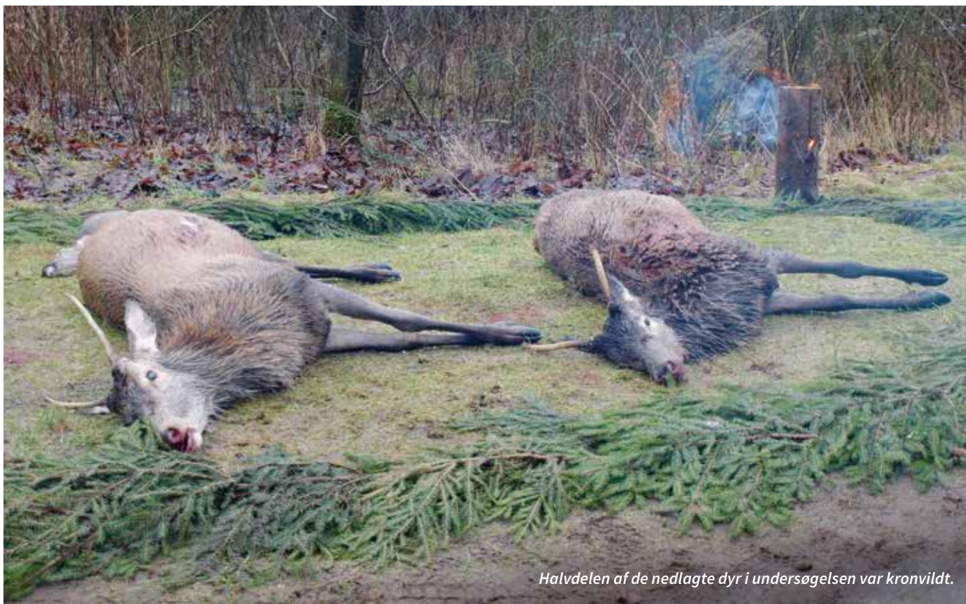
Halvdelen af de nedlagte dyr i undersøgelsen var kronvildt.