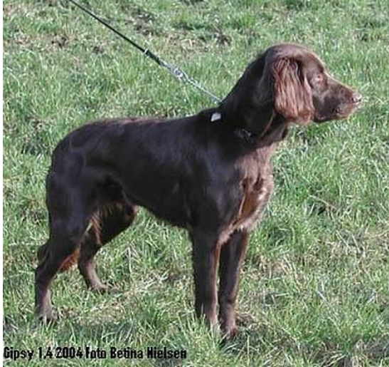
Gipsy 1,4 2004