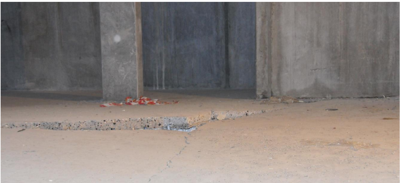
Vand under isoleringen under kældergulvet fik dette betonlåg til at revne og flere steder hæve sig over en halv meter!

Flot reageret af entreprenøren og dennes underleverandører! Hvor ville det have været ærgerligt at skulle have udskudt indflytningen med et par måneder på grund af dette næsten værst tænkelige uheld her "fem minutter i tolv".