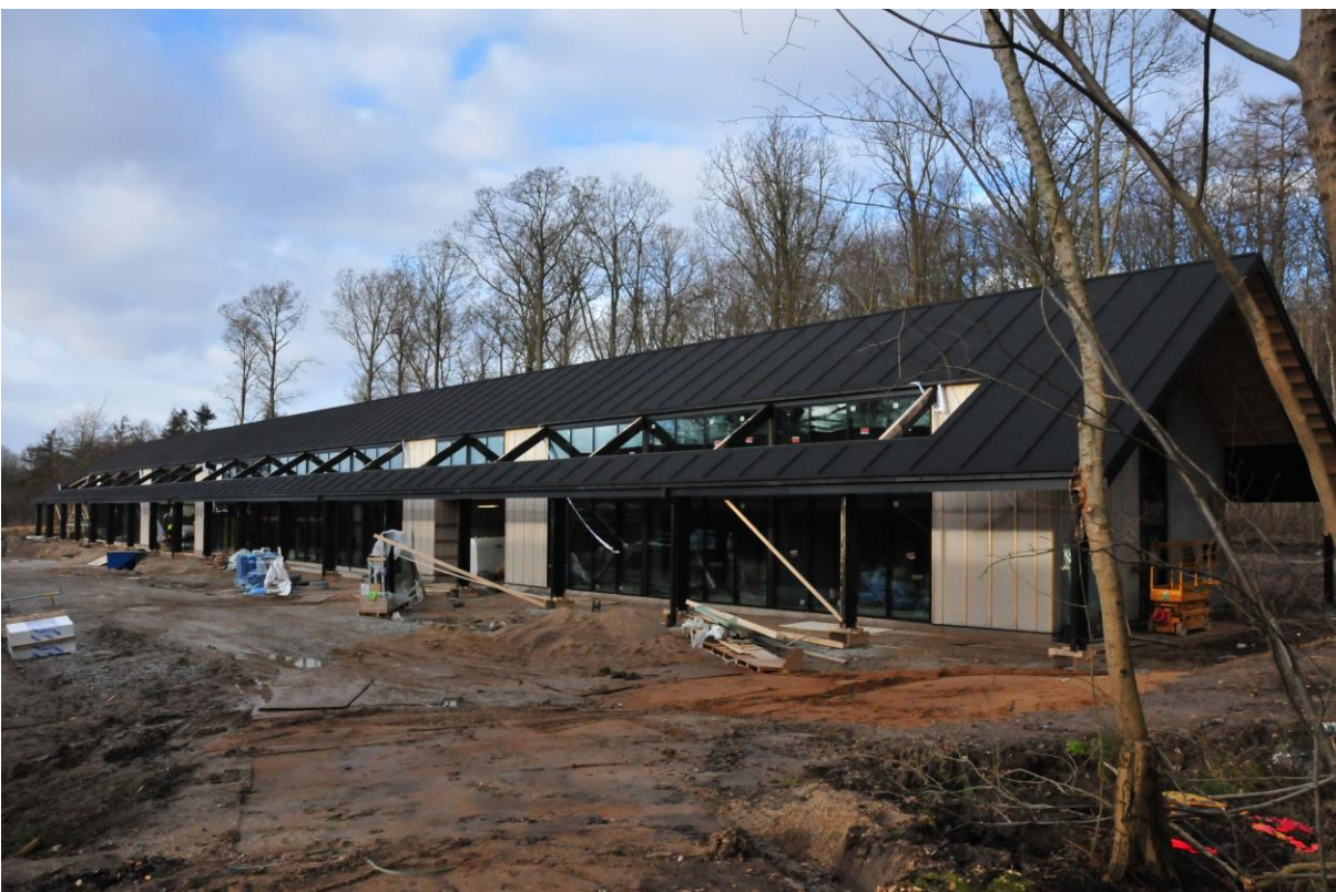
Videncenteret set mod nordvest. Der mangler stadig sort træbeklædning på diverse hjørner og under tagudhænget.