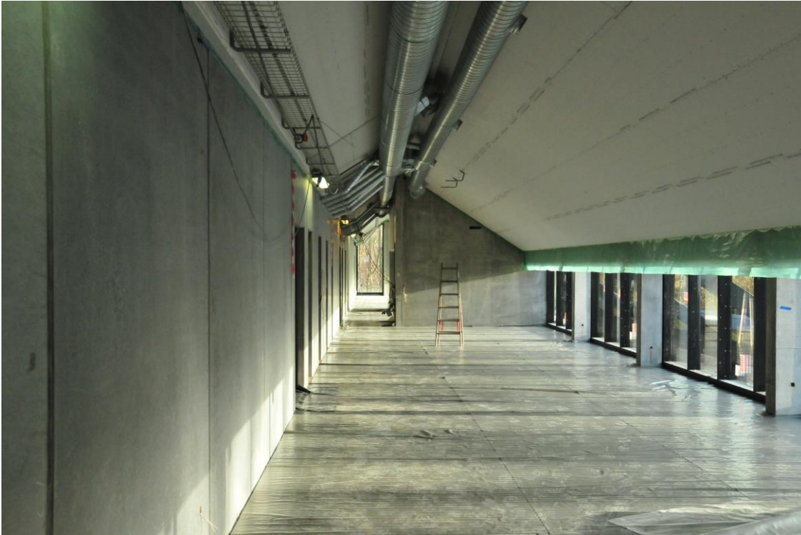
Her er et af Videncenterets kontorafsnit klar til at få monteret lofter og lagt trægulv.

Væggene bliver også en blanding af hvidmalede, hvide klinker, rå beton og sorte trælister alt afhængig af, hvilken funktion og/eller stemning, der ønskes.