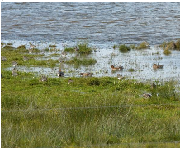
Afgræsning forbedrer vilkårene for ande- og vadefugle.

Mange ande- og vadefugle kræver fugtige lysåben natur med en vegetation, som ikke må være for høj. Afgræsning er derfor mange steder en nødvendighed for at modvirke, at fugtige lysåben natur invaderes af høje græsser, rørskov og pilekrat.