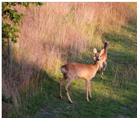
Elektrisk hegn bestående af en eller to tråde er normalt ingen hindring for vildtet.

Nethegn med meget små masker kan hindre de mindre pattedyr som f.eks. harens adgang til det hegnede areal, og bør derfor ikke anvendes.