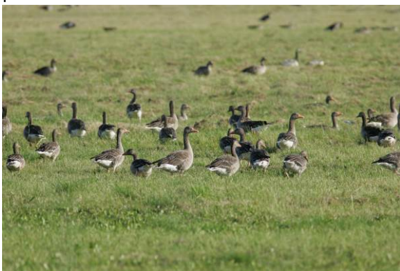
Afgræsning forbedrer vegetationens foderkvalitet til gavn for vildtet.

Afgræsning er med til at forbedre fødegrundlaget for alt det vildt, som lever af græs og urtevegetation, da afgræsning er ensbetydende med den nye genvækst forbedrer vegetationens foderkvalitet. Græsning skaber variation og medfører en artsrig flora, som tiltrækker flere insekter, hvilket er til stor gavn for specielt hønsefugle og deres afkom, men også for andre insektædende fugle, pattedyr og padder.