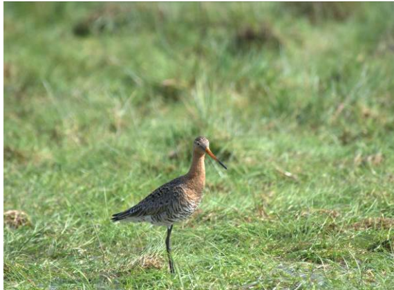
Undgå at afgræsse arealer, der kendes som engfuglenes ynglesteder i yngletiden.

( http://naturstyrelsen.dk/media/nst/Attachments/533635.pdf ) kan dyrene, der benyttes til afgræsningen, med fordel sættes på græs på de højt beliggende arealer allerede i maj, hvis de lavereliggende arealer hegnes fra og tages ud af afgræsning indtil fuglenes yngletid er overstået.