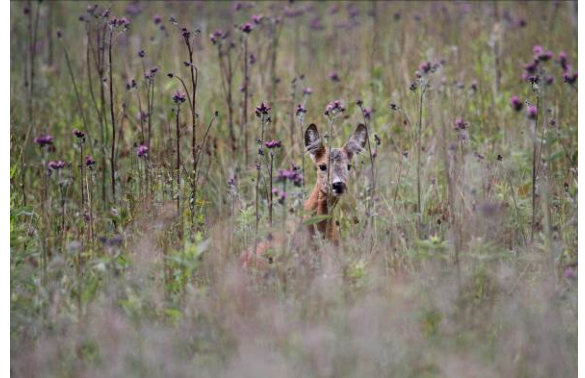
Mange vildtarter har behov for skjul i kort afstand fra fødesøgningsområderne.

Sørg også for, at der er mulighed for skjul på selve afgræsningsarealet, enten i form af små holme bestående af træer og buske på græsningsarealet, eller ved at trække hegnet ind i større områder med bevoksning. Herved får husdyrene samtidig bedre muligheder for at finde skygge og læ.