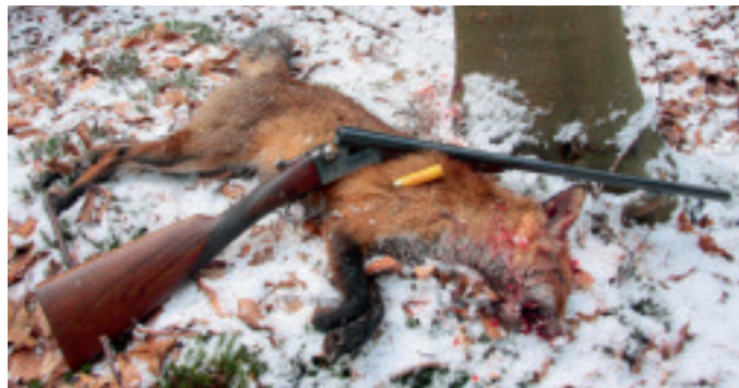
Ræven sneg sig forbi på bare to meters afstand.

Hunden gav kortvarigt hals under jorden. Til venstre for mig imellem bladene på de små bøge opdagede jeg to små sorte trekanter omkring tre meter borte. Ikke en lyd hørtes. Det gik op for mig, at der var tale om et par lodne ørespidser. Terrieren er hvid, brun og glathåret. Altså måtte det være en ræv. Hvor længe jeg stod og stirrede på ørespidserne, aner jeg ikke, men efter et stykke tid gled de langsomt forbi mig på et par meters afstand. Først nu kunne jeg se rævens snude, så kroppen, og så halen, men kun i brudstykker