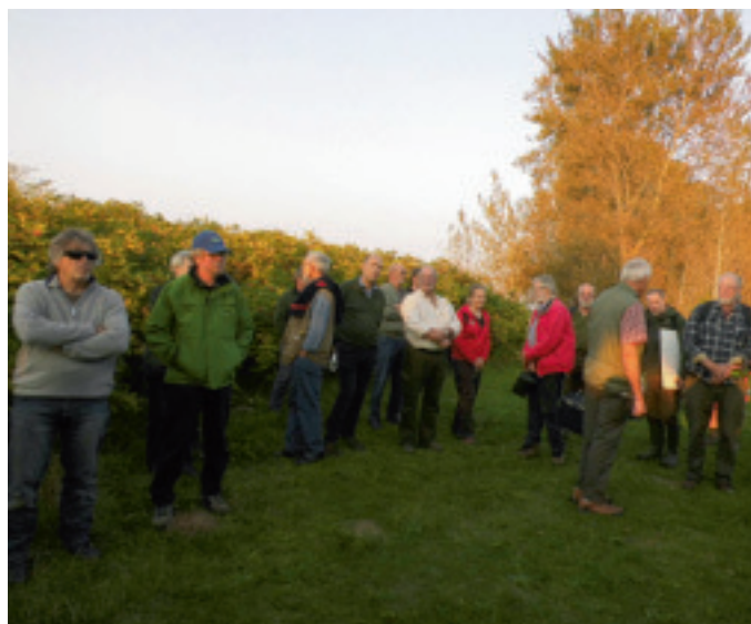
Mange tager på udflugt til Vigelsø for at opleve den unikke natur.

Det gode budskab er dog, at Naturskolen er bevaret for fremtiden og kan bookes af skoler, firmaer og organisationer. Skolen lejes dog ikke ud som forsamlingshus, festlokale eller til