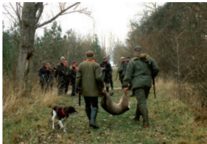
Nyjægerjagt i Kongelunden.

Det er for tidligt at sige, om Naturstyrelsen vil genoptage jagterne i 2015/16, men hvis det sker, så vil der blive tale om en nyjægerjagt.