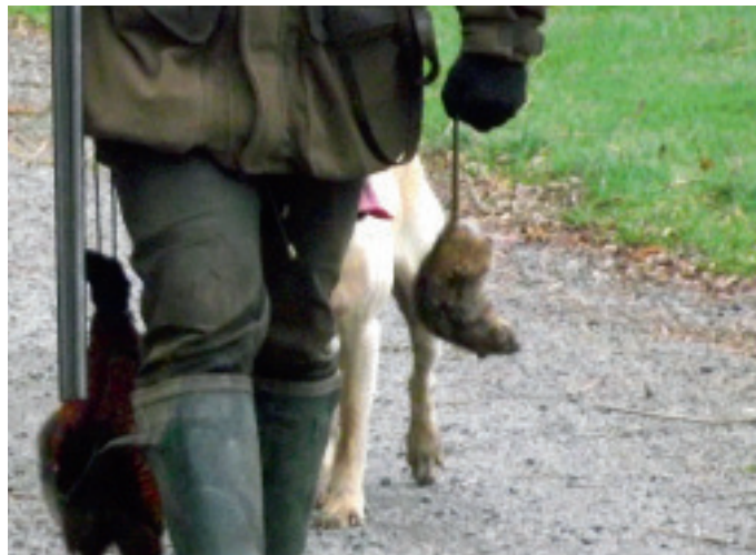
Så er der en rotte mindre.