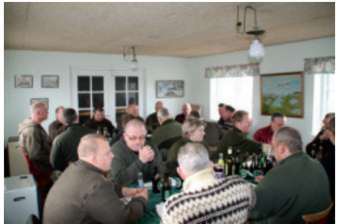
Efter en dag med rusk og regn var frokosten i jagthytten særdeles velkommen.

morgen og et fast håndtryk hele vejen rundt – ingen undtagelser. Efter morgenkaffen giver dagens jagtleder, kaldet Bent „Vognmand“, en grundig parole, hvor de obligatoriske regler bliver fortalt, og hvor vægten lægges på sikkerheden. En sikker forberedelse er bedre end en farlig træffer, siger han. Så er det tid til at gøre sig klar med varm jakke, gummi-støvler, gevær, samt reflekser for sikkerhedens skyld. Der blæses Jagt begynd, og så er der afgang ud i terrænet. Noget, der også kendetegner en helt rigtig jagt, er hundene, der løber mellem jægerne og er klar til at gøre det, der betyder mest for dem, nemlig at finde vildtet til os jægere. Dagen igennem servicerer vi med flot forplejning, hvor den velkendte kakao inden sidste sår altid falder på et tørt sted. Antallet af nedlagt vildt på tre fasa-