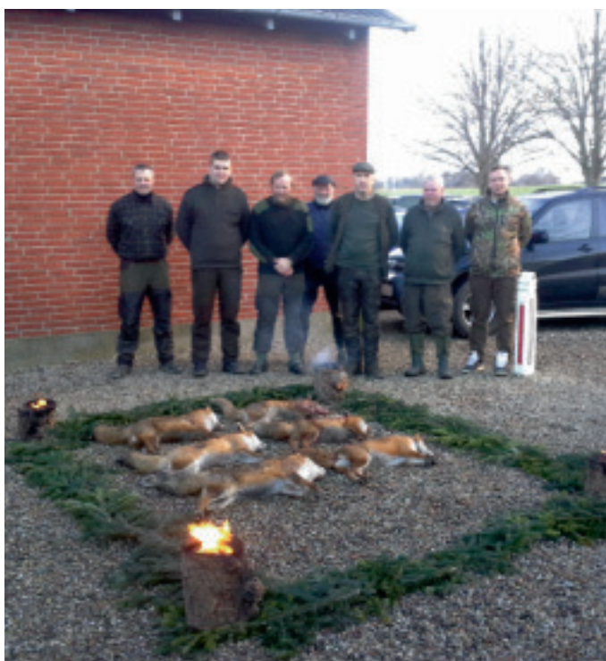
En flot parade omkranset af de effektive jægere.

Vigelsø er i besiddelse af en enestående natur, der nok er et besøg værd.