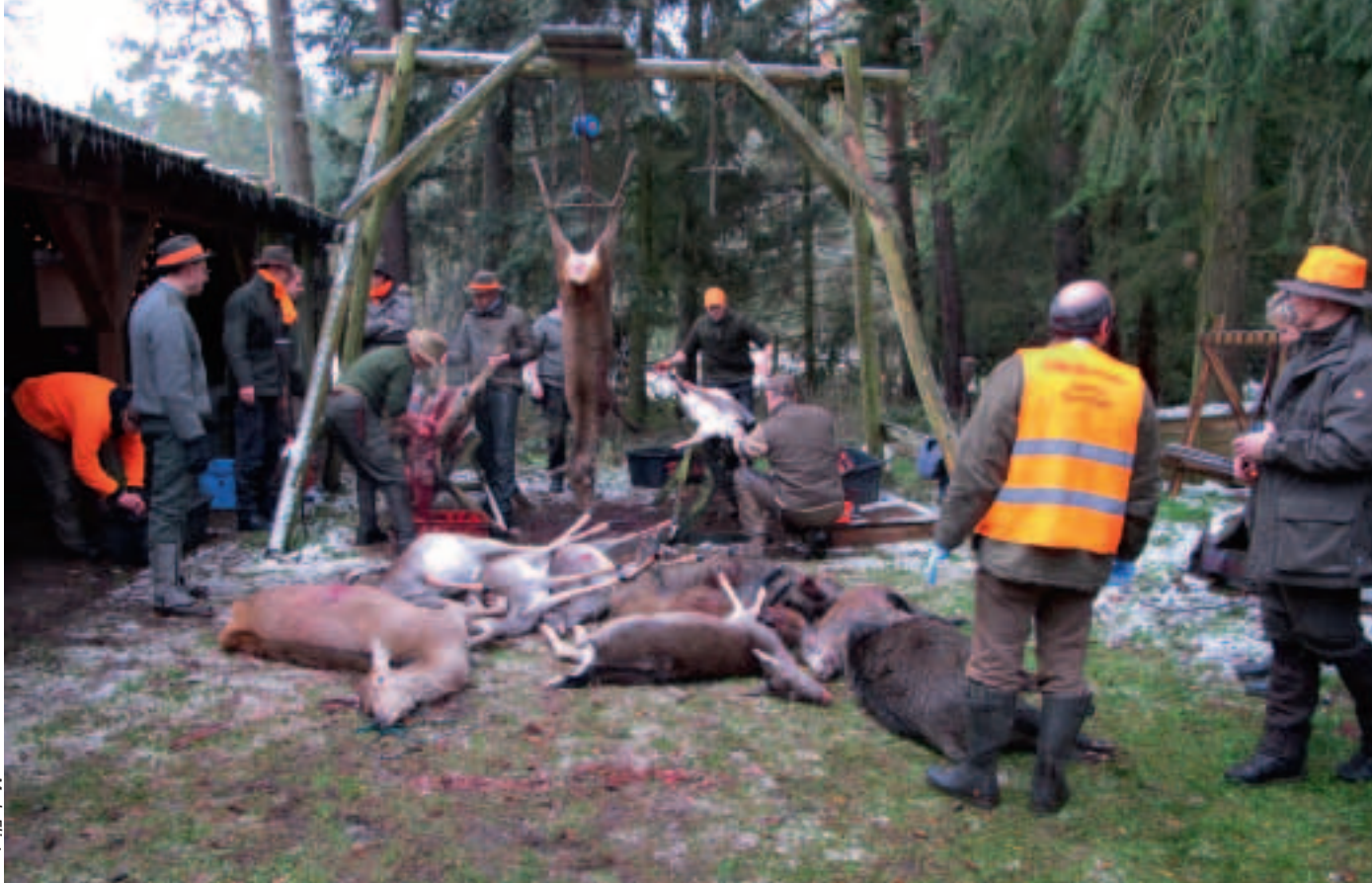
Opbrækning af vildtet et centralt sted er en stor hygiejnisk fordel. Det letter også arbejdet for eventuelle schweishundeførere, som skal eftersøge efter jagten!

► det. Det er en befrielse at få rørt sig igen. Jeg er kort efter ude på den skovvej, hvor jeg blev sat af. Til min store forbløffelse står der allerede to andre jægere. Det viser sig, at jeg har siddet mindre 50 meter fra skellet ind til naboen. De to jægere har siddet på den anden side af vejen. Den ene havde set en hund drive med et rådyr. Den anden havde leveret en kronkalv. Da han ca. 10 minutter før tid gik ned fra tårnet for at få blodomløbet i gang, kom der som skudt ud af en kanon en hind, spidshjort og kalv. De havde åbenbart taget ophold i den tykning, han sad op ad. I den retning, han så dyrene flygte, faldt der umiddelbart efter et skud. Det er formentlig forklaringen på den serie skud, der kom lige til lukketid. Når skytterne begynder at pakke sammen og gå ned, sættes der atter gang i vildtet.