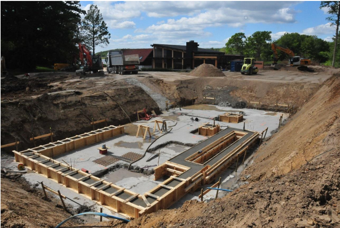
Fundamentet til kælderen under Videnscentret er nu lavet. Kælderen fylder cirka en trediedel af husets længde.