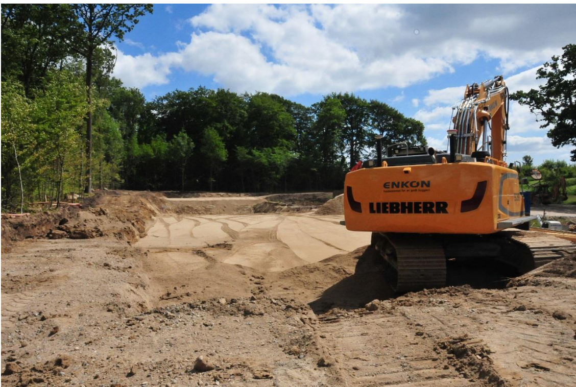
Sandpudden til Videnscentret er nu ved at være lavet. Så skal der støbes sokkel og monteres betonelementer.