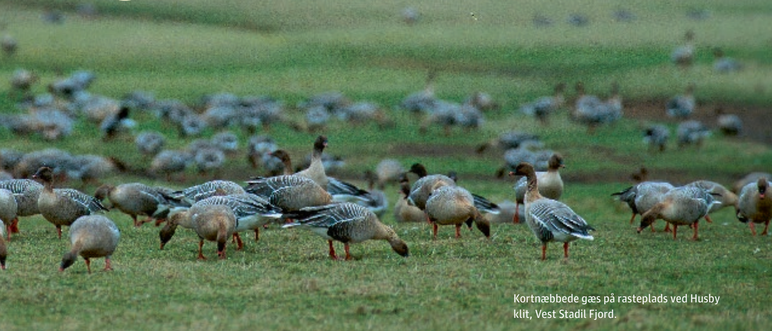
Kortnæbbede gæs på rasteplads ved Husby Klit, Vest Stadil Fjord.

- Baggrunden var, at deres vildt- og jagtforvaltning var meget ad hoc-præget og ukoordineret. Taler man f.eks. om trækvildt, der bevæger sig fra Canada gennem adskillige stater i USA og til Mexico, er der brug for en koordinering mellem disse områder. Det handler om at få et helikopterperspektiv, så man kan anskue bestandene ud fra en helhedsbetragtning. Det samme behov, som vi har med f.eks. den kortnæbbede gås. Det nytter jo ikke noget, hvis man vil reducere antallet af kortnæbbet gås og så griber sagen an på forskellig vis i de lande, hvor den opholder sig gennem året. Derfor har vi etableret det temmelig unikke samarbejde mellem Norge, Danmark, Holland og Belgien.