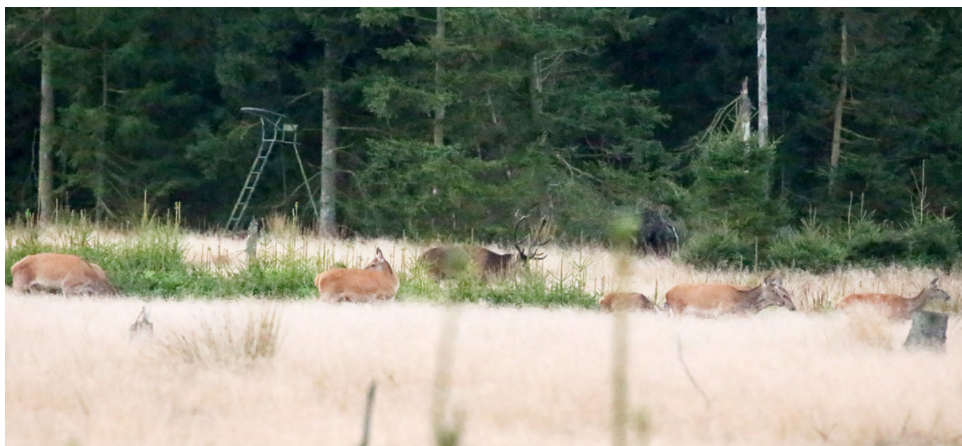
Store dele af det danske kronvildt lever stadig i og omkring de jyske plantager.

Forklaringerne herpå kan være mange og ikke mindst komplekse. Bortset fra enkelte grupper og laugs optegnelser over afskydningen er den officielle vildtudbyttestatistik – og