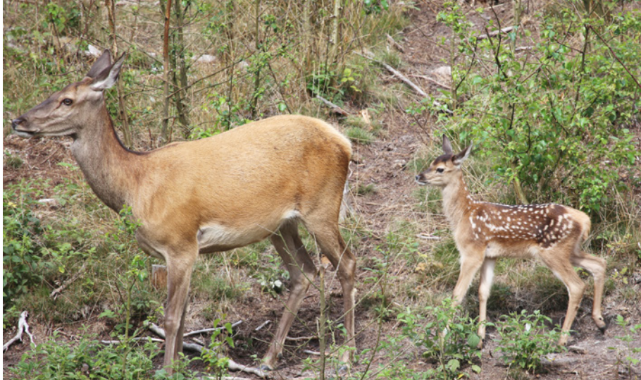
Den nysatte kalv følger hinden i tykt og tyndt det første halvandet år. Skydes hinden væk fra kalven, kan der opstå forvaltningsmæssige udfordringer.