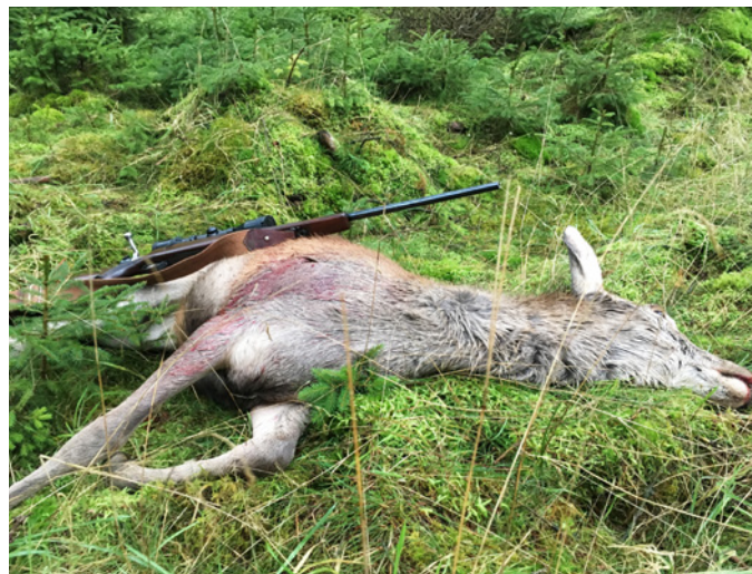
Uanset målsætningen for den lokale bestand, så er det væsentligt at kalve udgør den størstedel af udbyttet.

Vildtforvaltningsrådet arbejder ligeledes på at indstille en ny rammemodel for forvaltning af dåvildtet. Hvorledes den nuværende minister Jakob Ellemann-Jensen (V) ønsker at anvende Vildtforvaltningsrådets indstilling, vil tiden vise. Umiddelbart vurderes det, at bestandsvæksten i dåvildtbestandene i de kommende år bør bremses. I øjeblikket er markskader på grund af dåvildt ikke et tema, men en stadig stigende bestand vil forventeligt ændre på dette. mf@jaegerne.dk