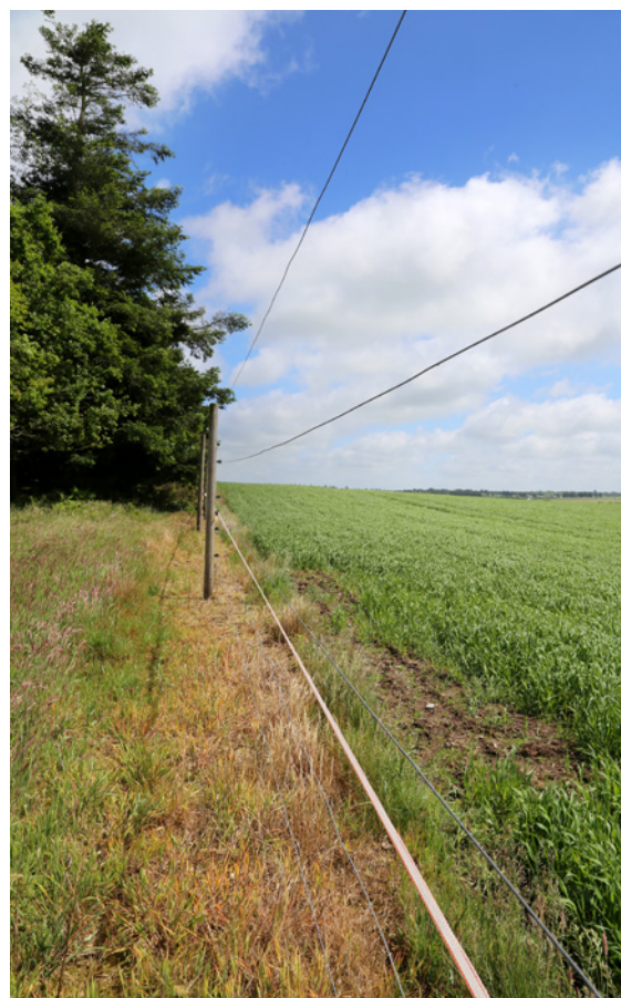
Det er ikke længere noget særsyn, at jyske landmænd forsøger at hegne kronvildtet ude af deres afgrøder.