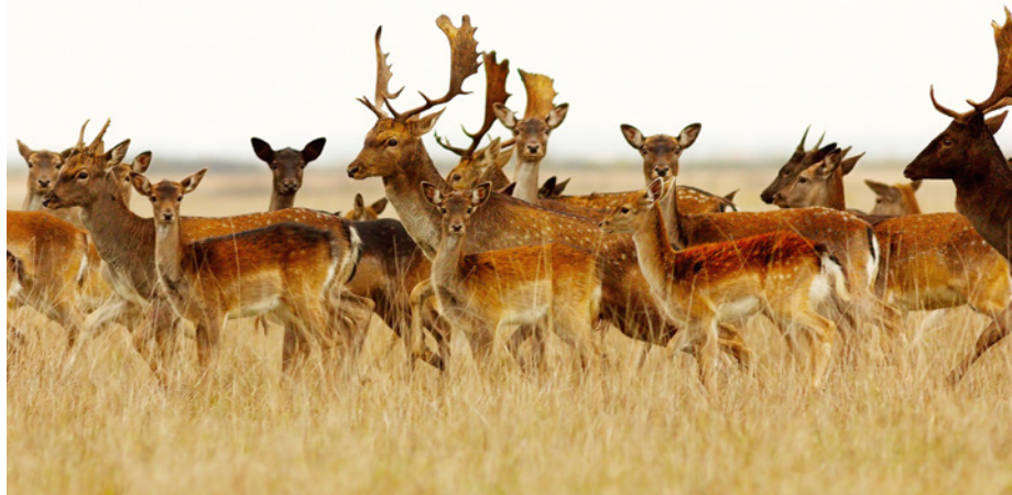
Hos dåvildtet er andelen af ældre hjorte i de fleste lokale bestande langt fra det ønskede. Udfordringen er, som ved kronvildtet, at hjortens gevir er et attraktivt trofæ i en tidligere alder, end hjorten biologisk er på toppen.

Af hjortevildtoversigten fra 1997 fremgik det, at den samlede fynske dåvildtbestand var på 1.053 dyr, fem