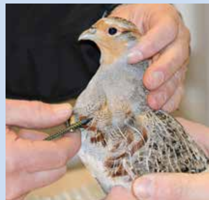
Agerhøne forsynes med den lille radiosender i et halsbånd, som placeres under brystfjerene med den tynde antenne bagudrettet. Under mærkningen er fuglene usædvanligt rolige, men fuglens vinger og ben skal holdes i et fast greb under processen.

Radiosenderne: VHF-radiosenderne vejer lidt over 10 gram og har batteri nok til at leve i otte til ni måneder. GPS-udstyr vil veje for meget for montering på en agerhøne, så de